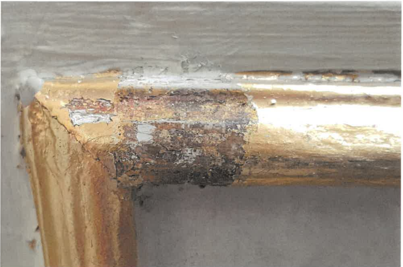
Fot.10. Fragment ołtarza głównego z kościoła pod wezwaniem Św. Jakuba w Niechanowie. Widoczne fragmenty czerwonego laserunku na pierwotnych złączeniach.