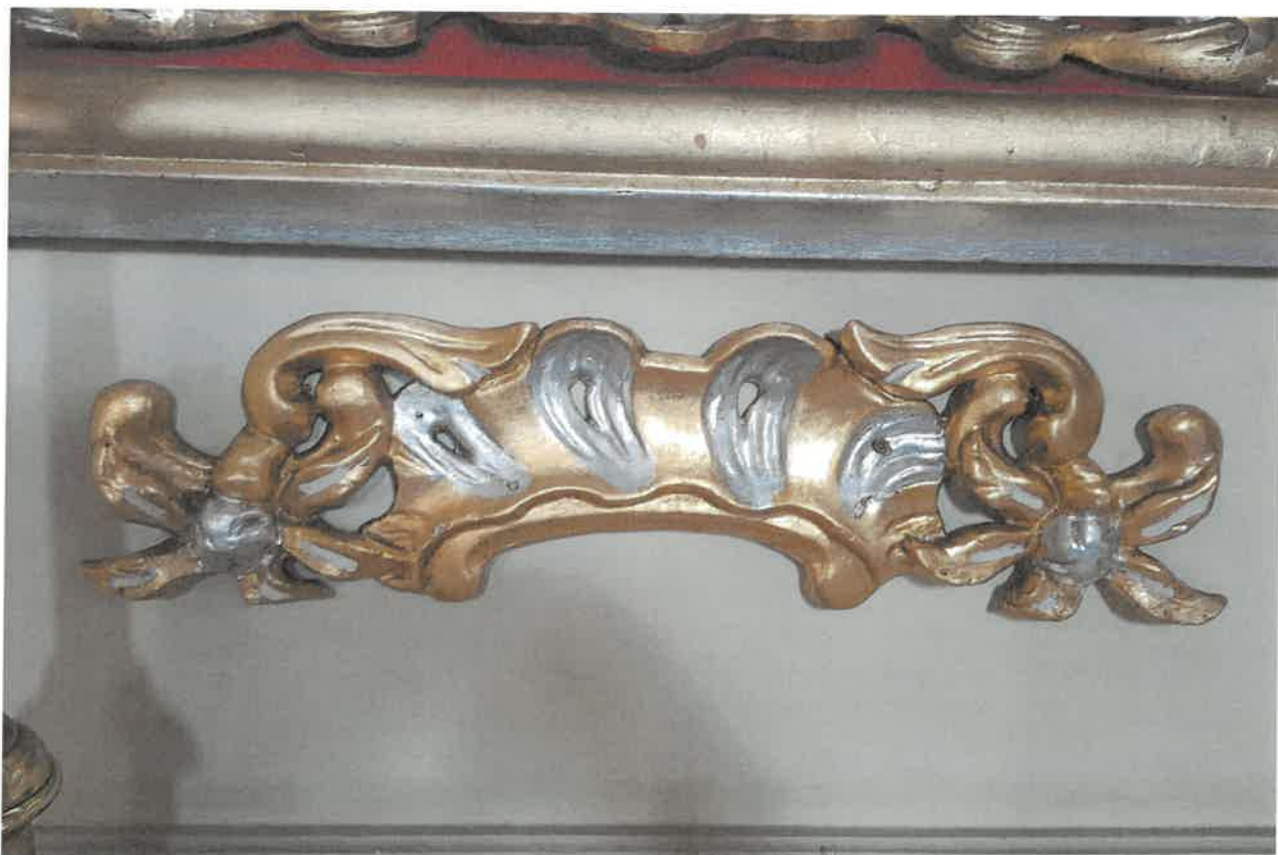
Fot. 5. Fragment ołtarza bocznego z obrazem Chrystusa Bolesciwego, z kościoła pod wezwaniem pod wezwaniem Św. Jakuba w Niechanowie.