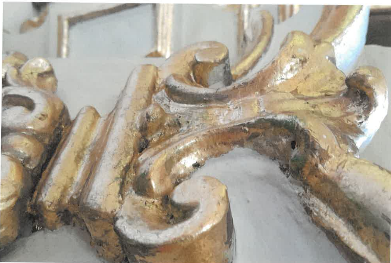
Fot.6 Ołtarz główny z kościoła pod wezwaniem pod wezwaniem Św. Jakuba w Niechanowie. Fragment złożonego detalu.