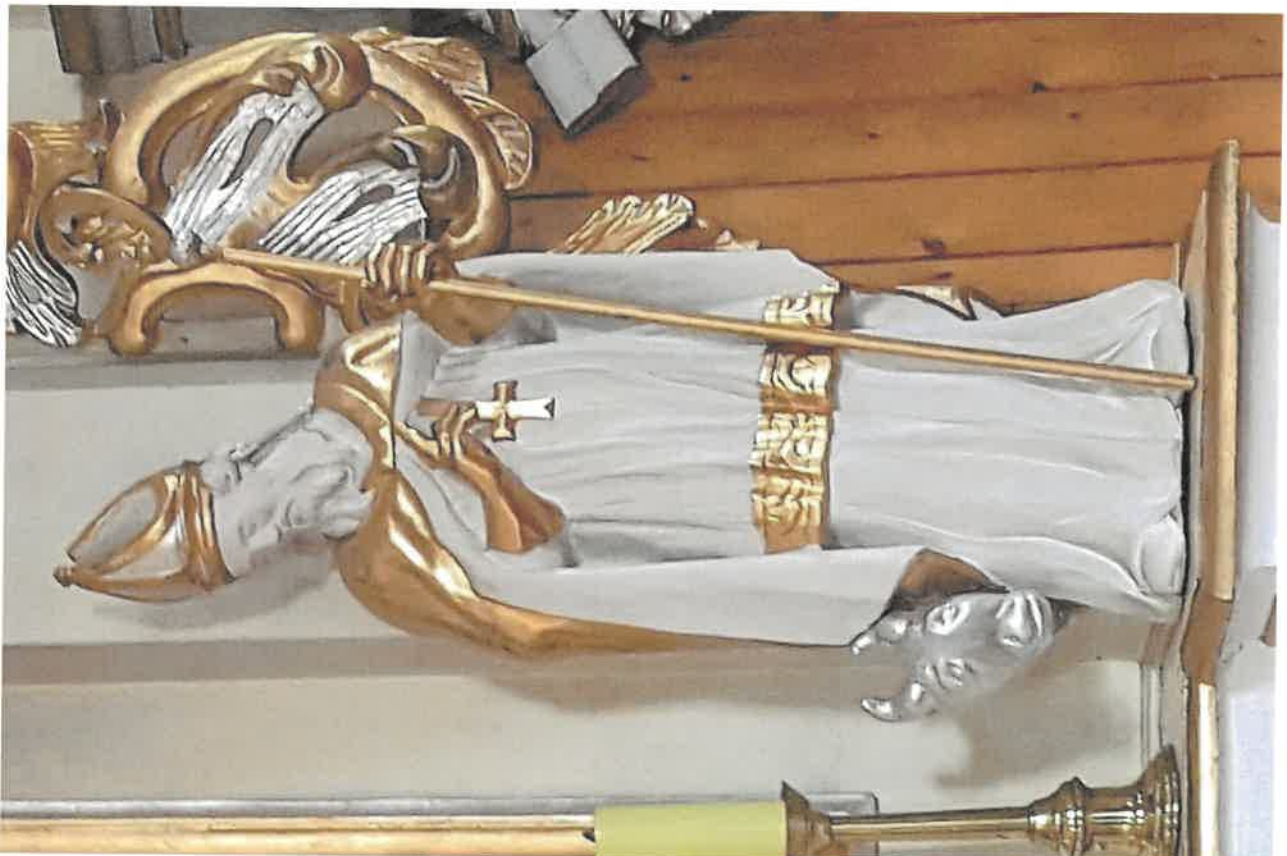
Fot. 3. Figura z ołtarza bocznego, z obrazem Chrystusa Boleskiego, z kościoła pod wezwaniem pod wezwaniem Św. Jakuba w Niechanowie.