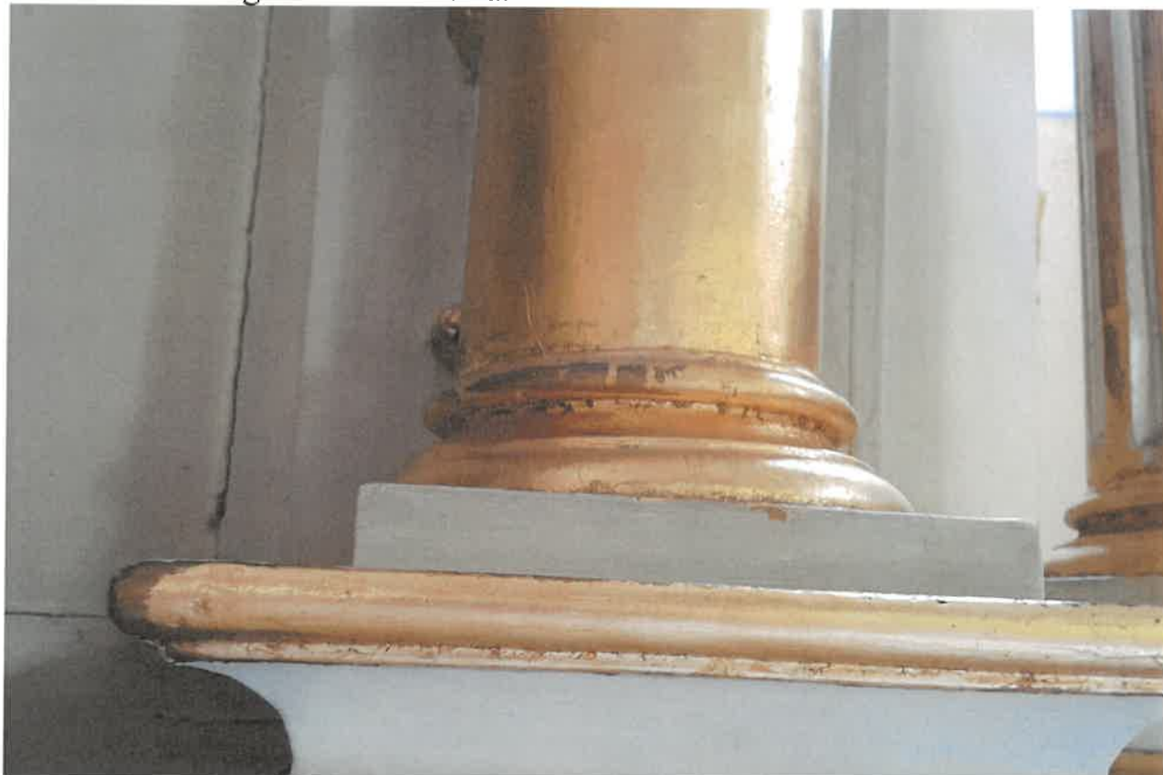
Fot.3. Ołtarz główny z kościoła pod wezwaniem pod wezwaniem Św. Jakuba w Niechanowie. Fragment kolumny z bazą.