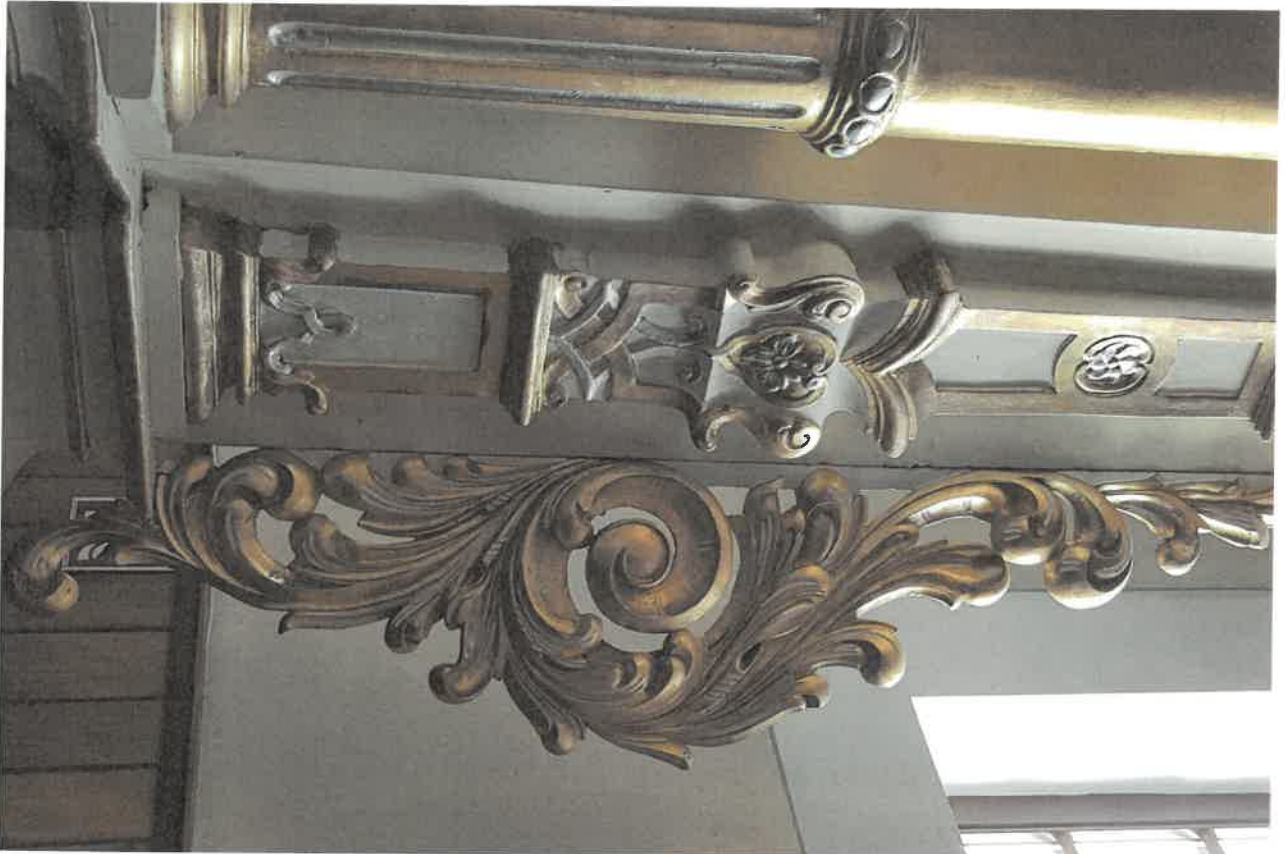
Fot.8. Fragment ołtarza głównego z kościoła pod wezwaniem Św. Jakuba w Niechanowie.