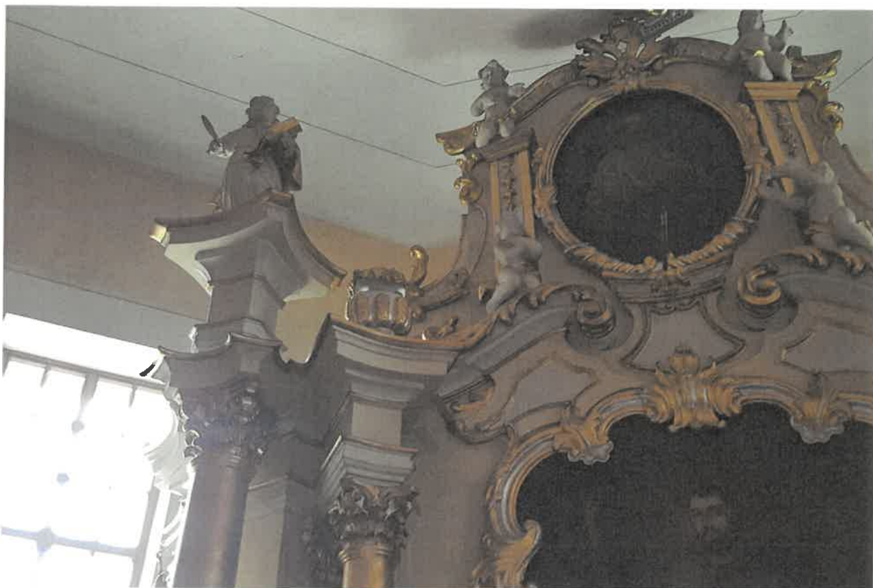
Fot.2. Ołtarz główny z kościoła pod wezwaniem pod wezwaniem Św. Jakuba w Niechanowie. Fragment zwieńczenia.