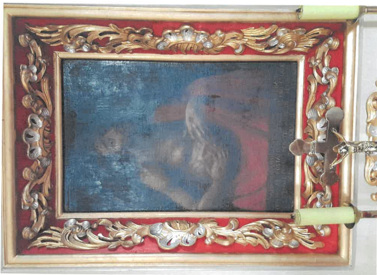
Fot. 4. Obraz Chrystusa Bolesciwego, z ołtarza bocznego w kościele pod wezwaniem Św. Jakuba w Niechanowie.