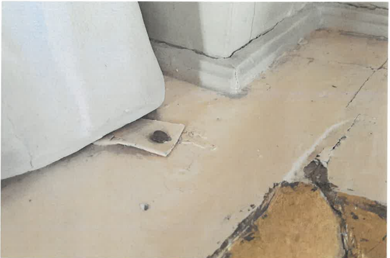
Fot. 7. Fragment ołtarza bocznego z obrazem Chrystusa Boleściwego, z kościoła pod wezwaniem pod wezwaniem Św. Jakuba w Niechanowie.