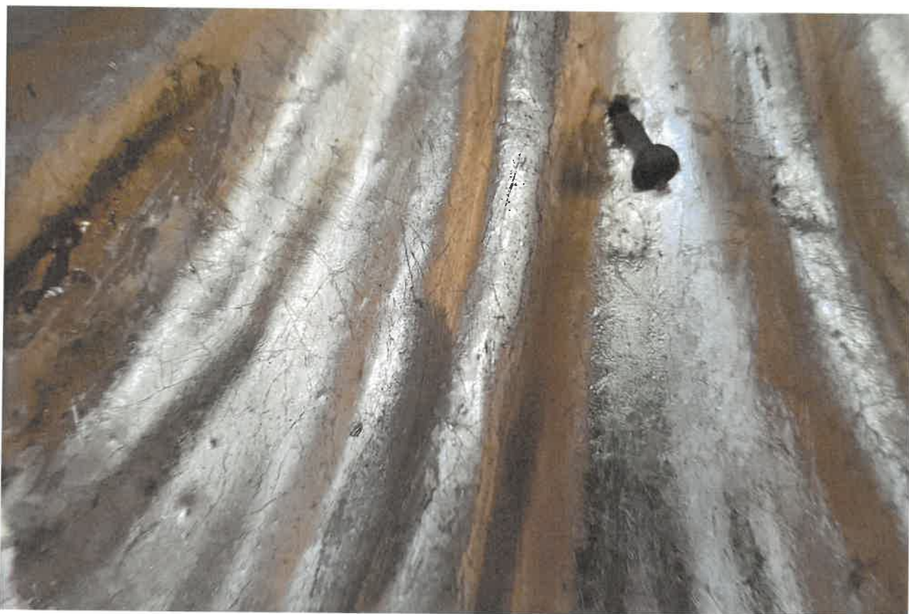
Fot.7. Fragment ołtarza głównego z kościoła pod wezwaniem Św. Jakuba w Niechanowie.