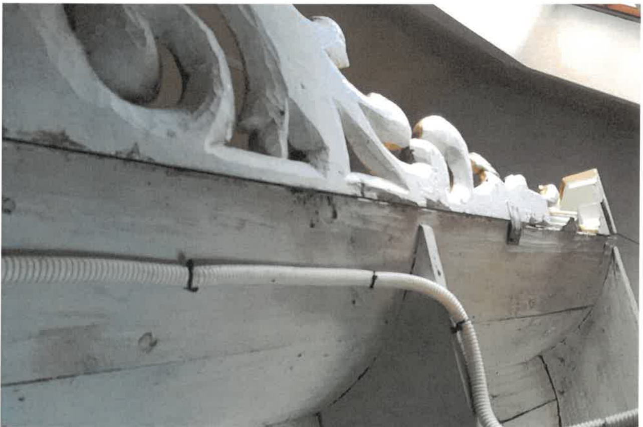
Fot.15. Fragment ołtarza głównego z kościoła pod wezwaniem Św. Jakuba w Niechanowie.