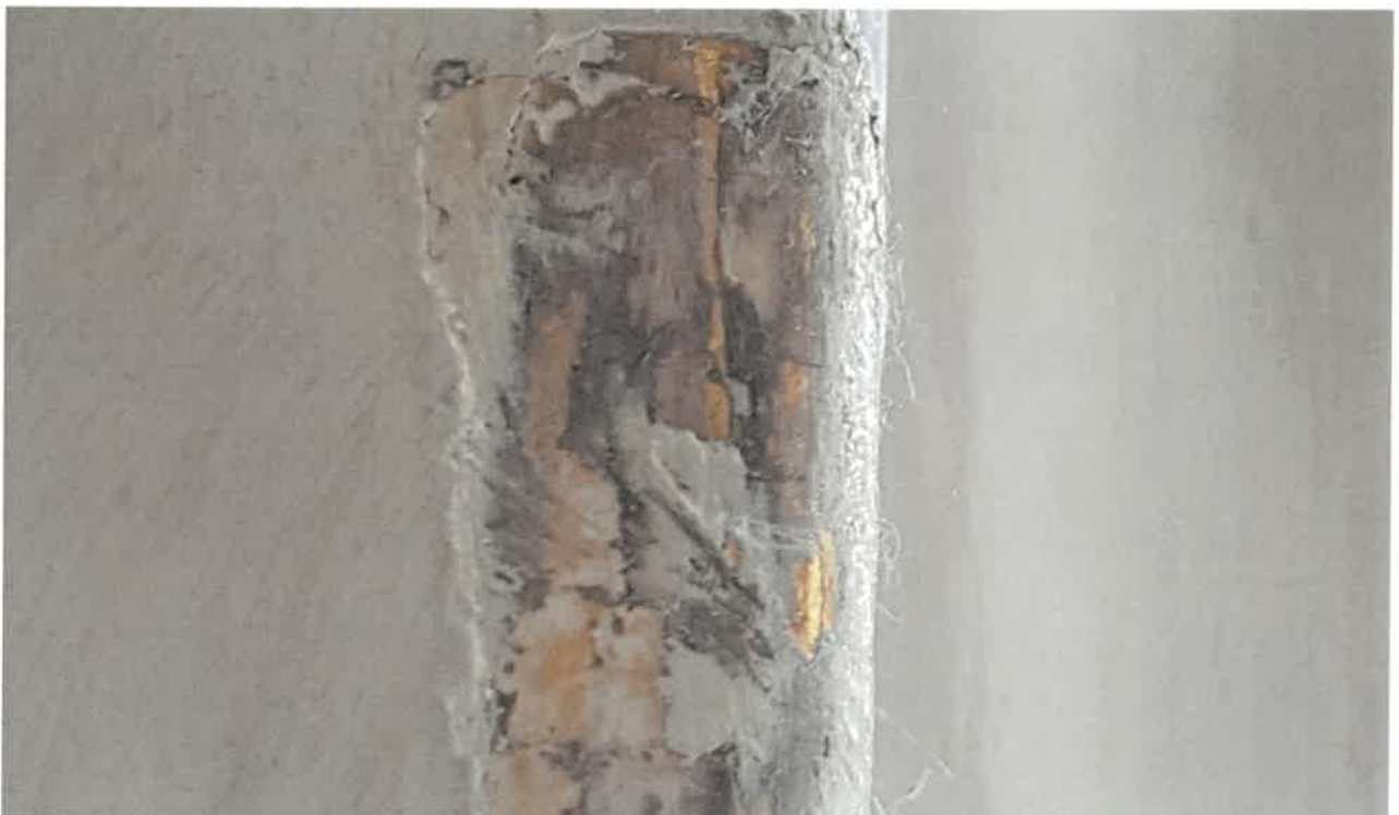
Fot. 8. Fragment ołtarza bocznego z obrazem Chrystusa Boleściwego, z kościoła pod wezwaniem pod wezwaniem Św. Jakuba w Niechanowie. Widoczne niewielkie pozostałości złocień na szatach świętych.