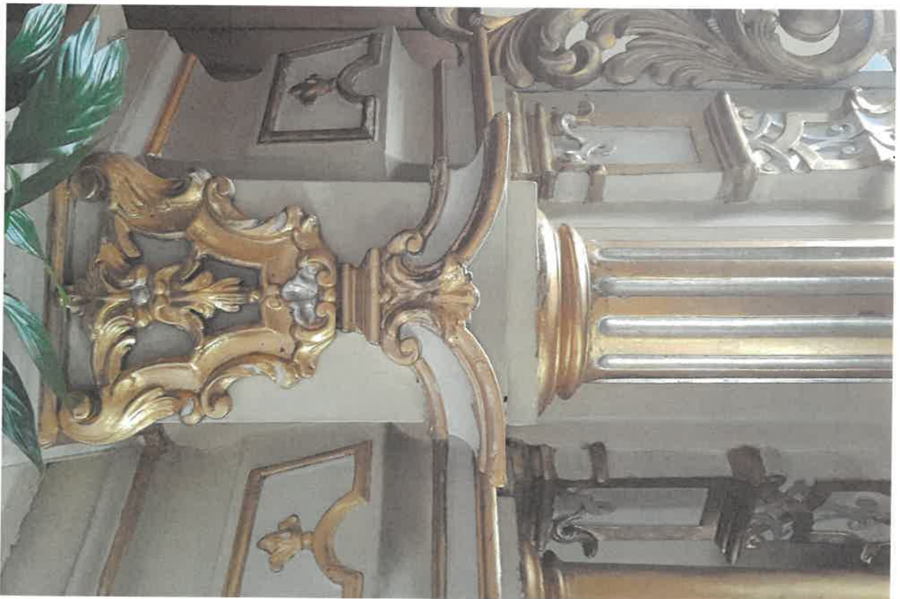
Fot.9. Fragment ołtarza głównego z kościoła pod wezwaniem Św. Jakuba w Niechanowie.