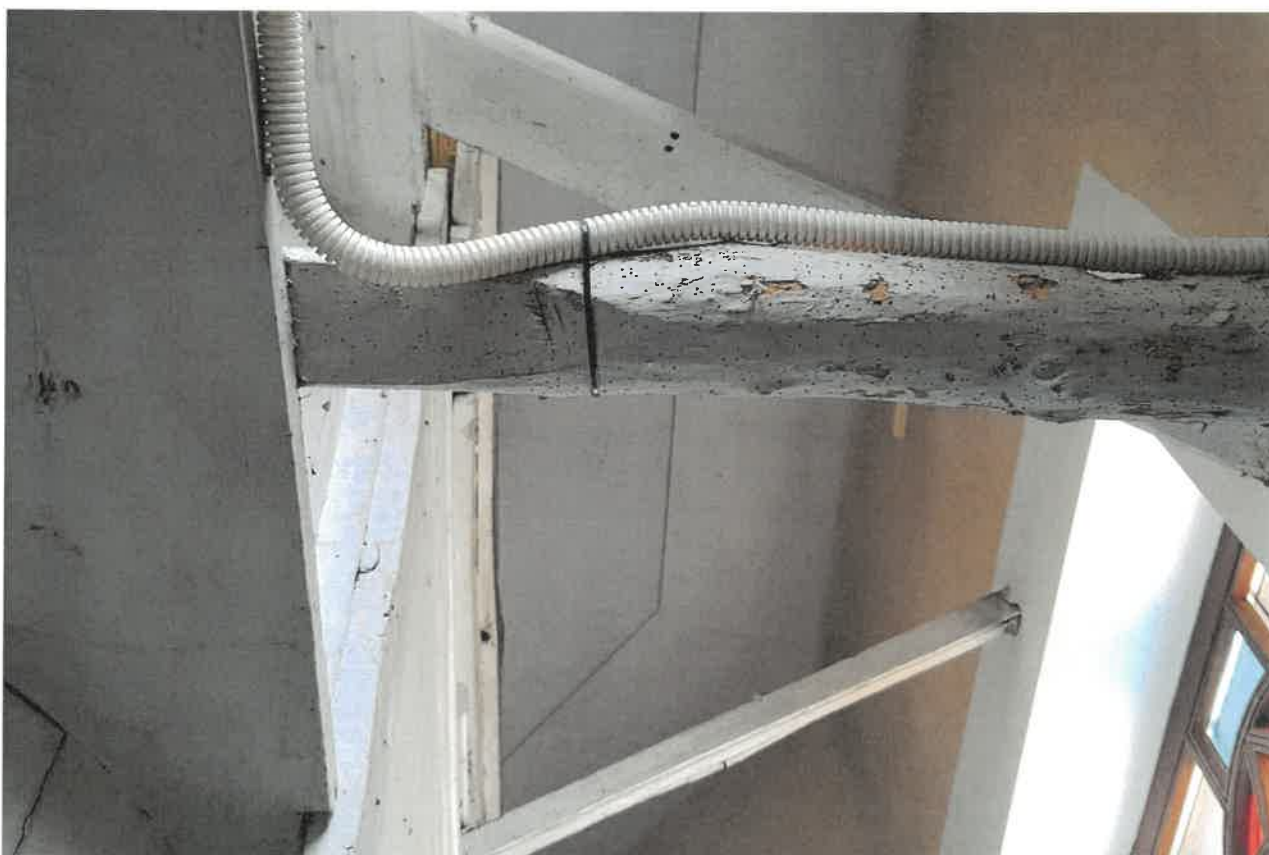
Fot.13. Fragment ołtarza głównego z kościoła pod wezwaniem Św. Jakuba w Niechanowie. Stan zachowania drewnianej konstrukcji.