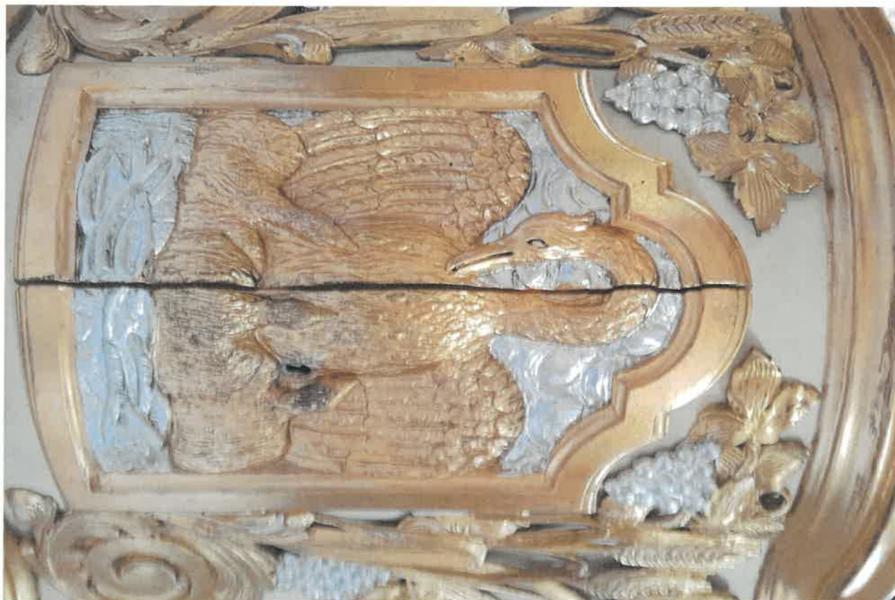
Fot.12. Fragment ołtarza głównego z kościoła pod wezwaniem Św. Jakuba w Niechanowie. Widoczne wtórne złączenia na tabernakulum.