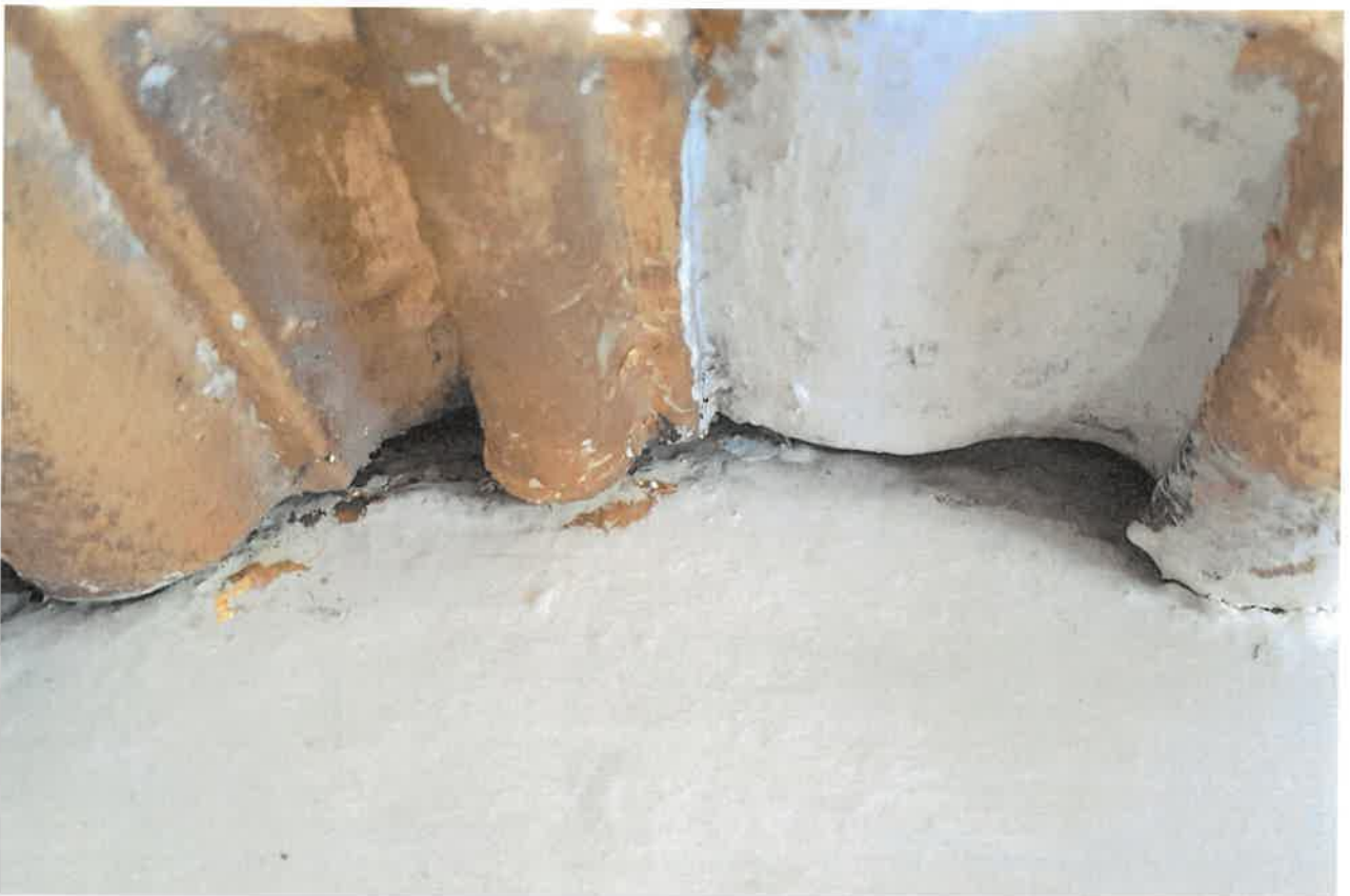
Fot.5. Ołtarz główny z kościoła pod wezwaniem pod wezwaniem Św. Jakuba w Niechanowie. Fragment złożonego detalu.