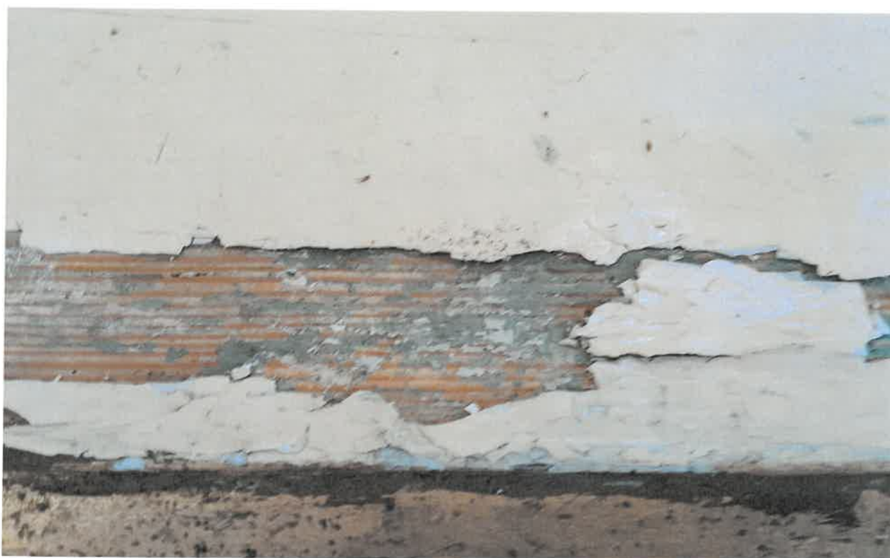
Fot. 4. Fragment naturalnej odkrywki. Ołtarz boczny z kościoła pod wezwaniem pod wezwaniem Św. Jakuba w Niechanowie.