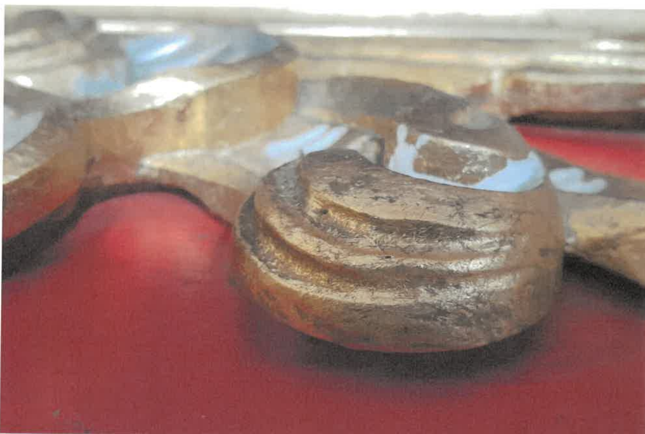
Fot. 6. Fragment ołtarza bocznego z obrazem Chrystusa Bolesciwego, z kościoła pod wezwaniem pod wezwaniem Św. Jakuba w Niechanowie.