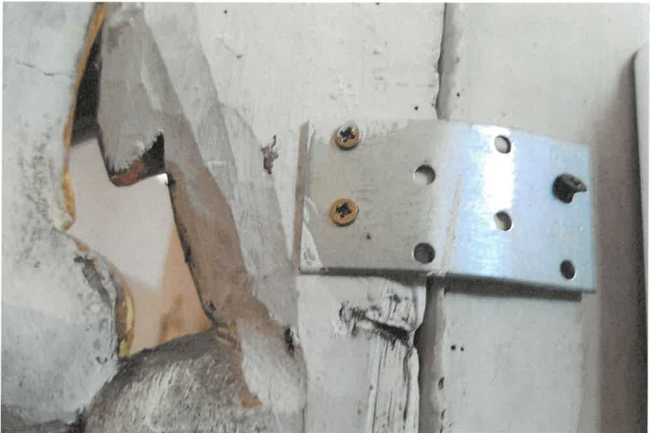
Fot.14. Fragment ołtarza głównego z kościoła pod wezwaniem Św. Jakuba w Niechanowie.