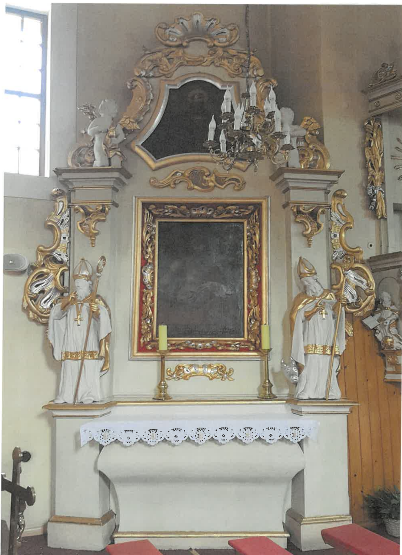
Fot. 1. Ołtarz boczny Chrystusa Bolesciwego z kościoła pod wezwaniem pod wezwaniem Św. Jakuba w Niechanowie.