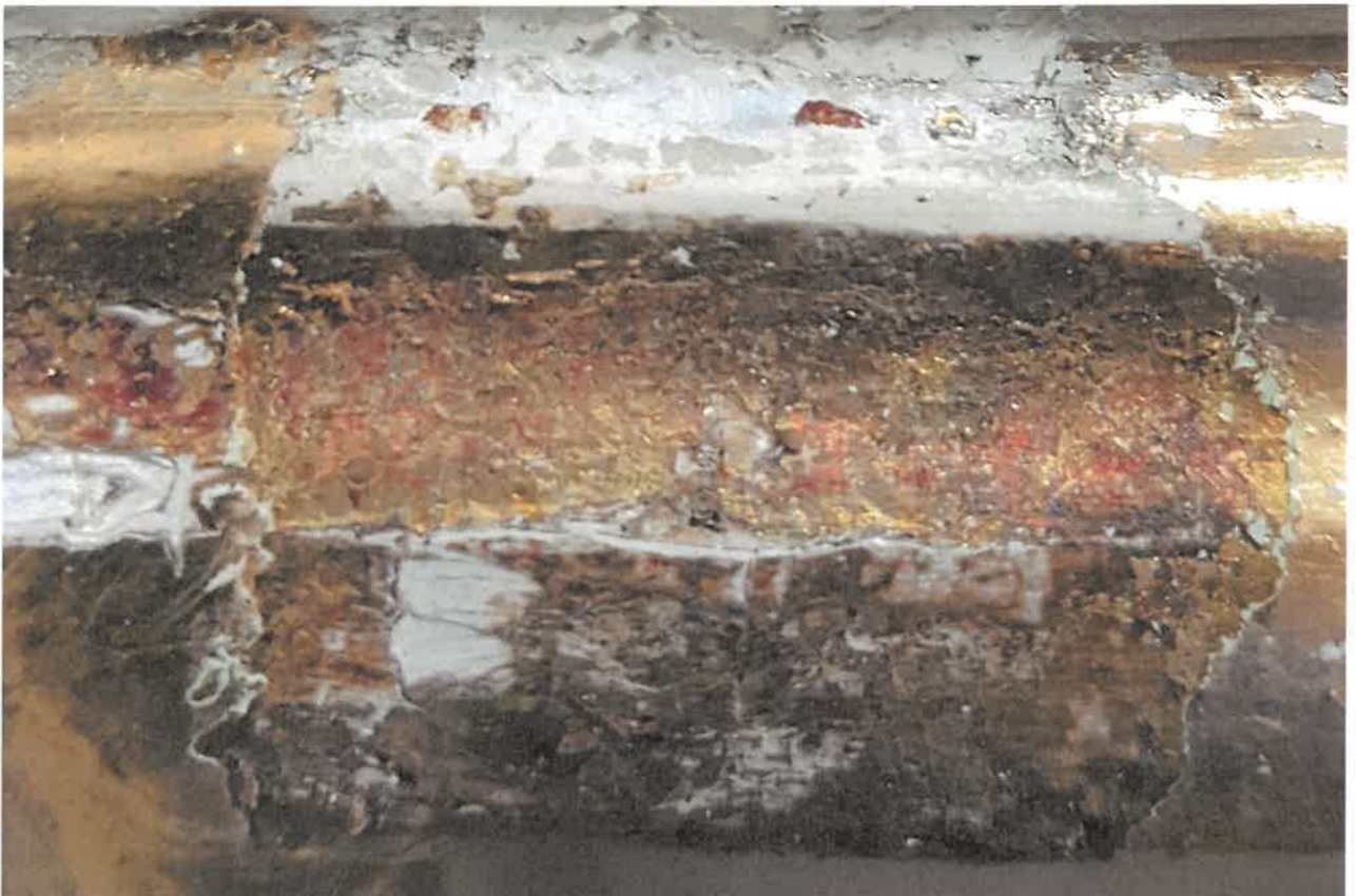
Fot.11. Fragment ołtarza głównego z kościoła pod wezwaniem Św. Jakuba w Niechanowie. Widoczne fragmenty czerwonego laserunku na pierwotnych złączeniach.