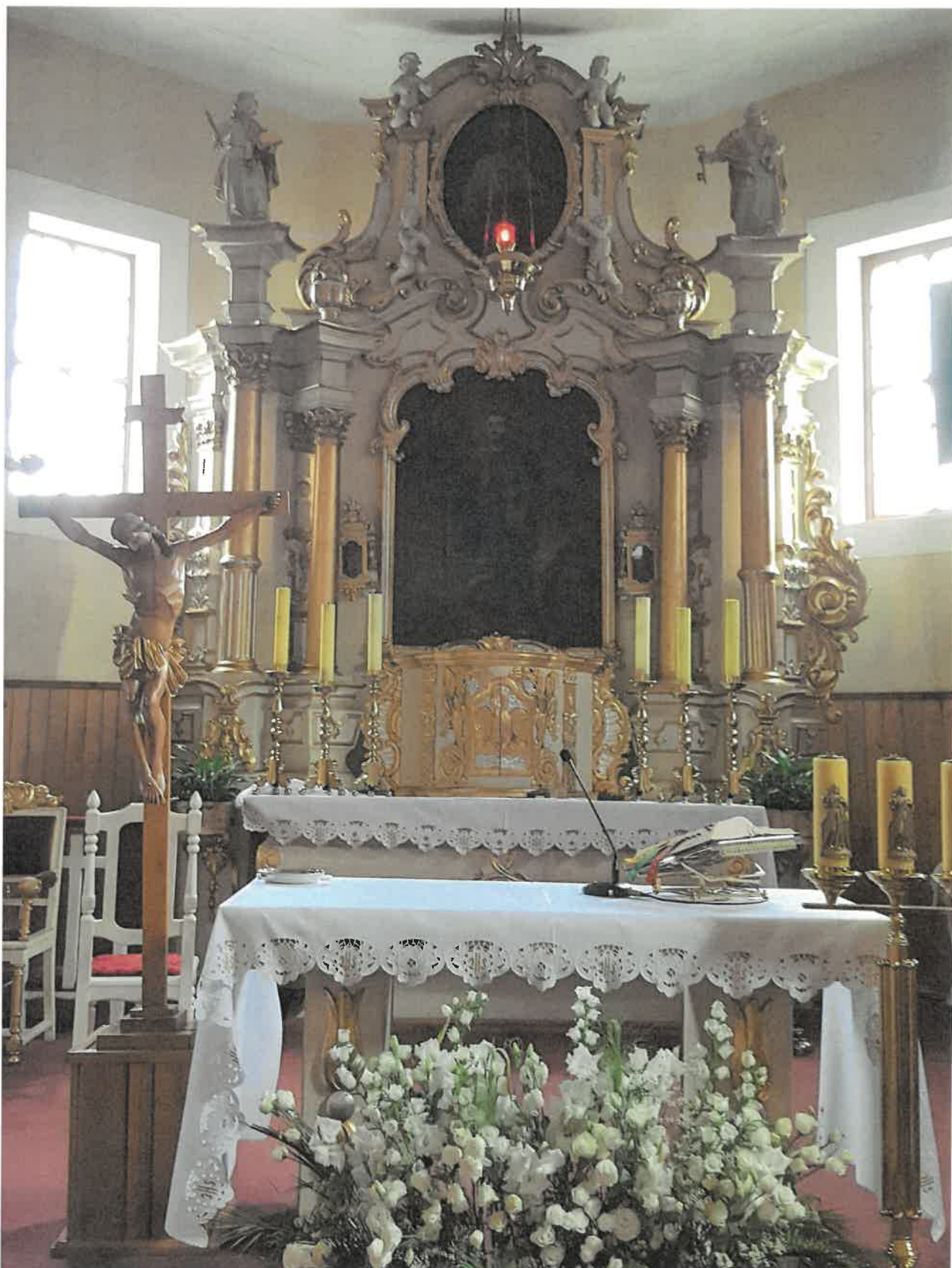
Fot. 1. Ołtarz główny z kościoła pod wezwaniem pod wezwaniem Św. Jakuba w Niechanowie.